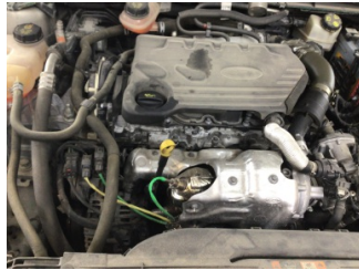
Motor, Motor üst kapağı, plastik > Yağ Kaçağı