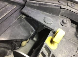
Farlar, Far, sol > Standart Dışı Onarım