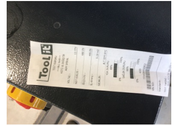
Elektrik donanımı/Pano, Akü > Test Sonucu