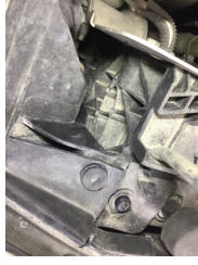
Farlar, Far, sağ > Standart Dışı Onarım