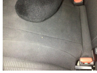
Koltuklar, arka, Arka koltuk > Yakıcı Madde Ile Zarar Görmüş