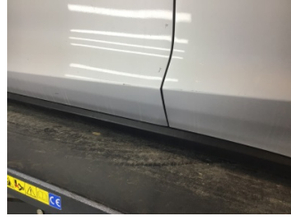
Kapı, sol ön, Kapı, sol ön > Çizik