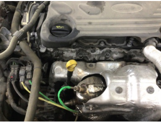
Motor, Motor üst kapağı, plastik > Yağ Kaçağı