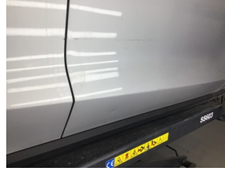
Kapı, sağ ön, Kapı, sağ ön > Noktasal Ezik