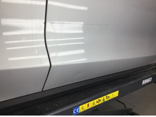
Kapı, sağ ön, Kapı, sağ ön > Çizik