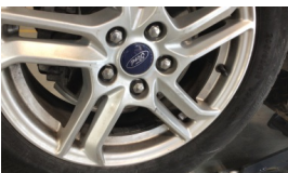
Jant, sağ arka > Ezik