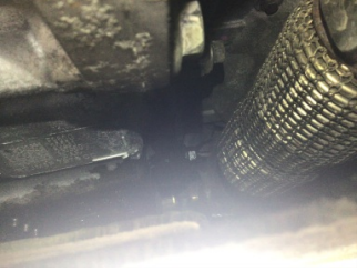
Şanzıman, Şanzıman > Yağ Kaçağı