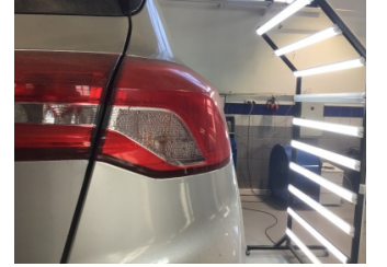
Arka lambalar, Arka lambalar, sağ > Hasarlı