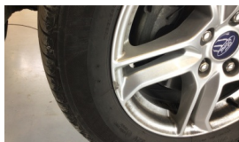
Jant, sol ön > Ezik