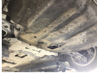
Motor, Alt muhafaza > Deforme Olmuş