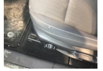
Koltuklar, ön, Koltuk, sol ön > Yakıcı Madde Ile Zarar Görmüş