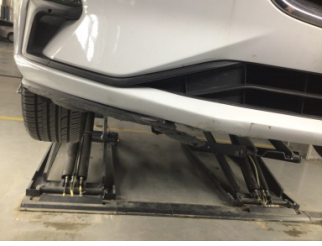
Tampon, ön, Spoiler > Hasarlı