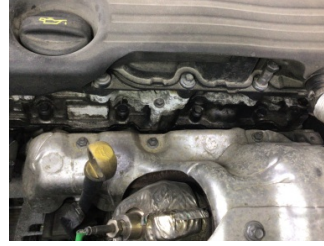
Motor, Motor üst kapağı, plastik > Yağ Kaçığı