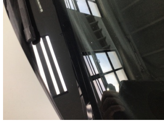
Camlar, Ön cam > Taş İzi