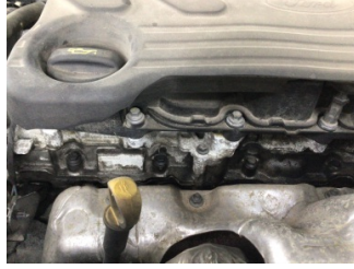
Motor, Motor üst kapağı, plastik > Yağ Kaçığı