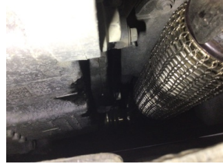
Motor, Yağ karteri > Yağ Kaçığı