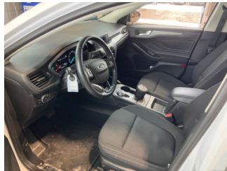
Döşemeler/Kapaklar, Döşemeler/Kapaklar > Kirlenmiş