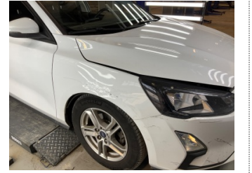
Çamurluk, sol, Çamurluk, sol > Hasarlı