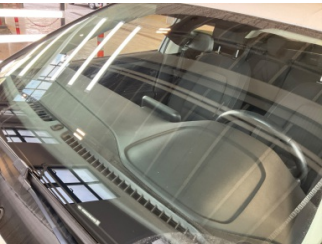
Camlar, Ön cam > Taş izi