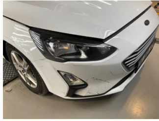
Tampon, ön, Ön tampon > Hasarlı