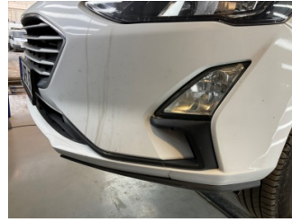
Tampon, ön, Ön tampon > Hasarlı