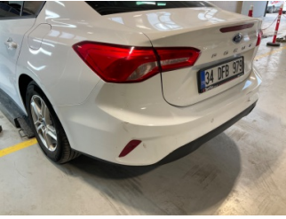
Tampon, arka, Arka tampon > Hasarlı