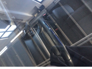
Camlar, Ön cam > Taş izi