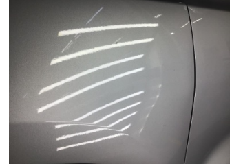
Çamurluk, sol, Çamurluk, sol > Çizik