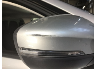
Dikiz aynası, sağ, Dış dikiz aynası > Çizik