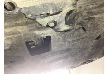
Motor, Alt muhafaza > Hasarlı