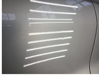
Kapı, sağ arka, Kapı, sağ arka > Noktasal Ezik