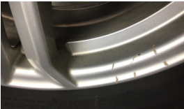
Jant, sol arka > Çizik