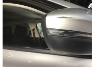
Dikiz aynası, sağ, Sinyal lambası > Çizik