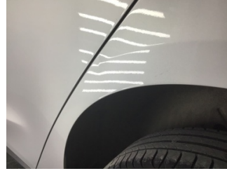
Çamurluk, sol arka, Çamurluk, sol arka > Noktasal Ezik