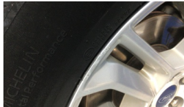
Jant, sağ ön > Çizik