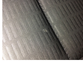
Koltuklar, ön, Koltuk, sol ön > Yakıcı Madde ile Zarar Görmüş