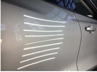
Kapı, sağ arka, Kapı, sağ arka > Çizik