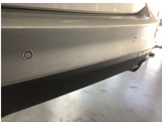
Tampon, arka, Arka tampon > Ezik