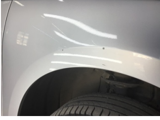
Çamurluk, sağ, Çamurluk, sağ > Çizik

Sayfa: 1/1 Araç Çıkış Tarihi: 08.11.2024 16:21