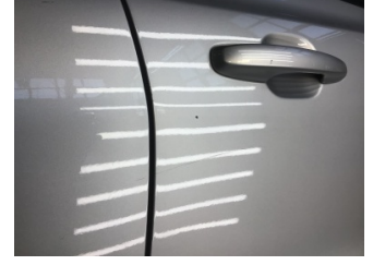
Kapı, sağ ön, Kapı, sağ ön > Çizik