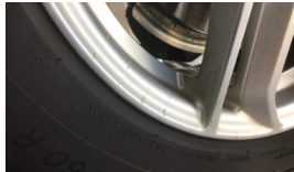
Jant kapağı, sağ arka > Çizik