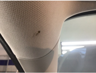
Döşemeler/Kapaklar, Tavan döşemesi > Yakıcı Madde ile Zarar Görmüş