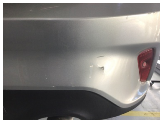
Tampon, arka, Arka tampon > Ezik