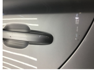
Kapı, sol arka, Kapı, sol arka > Çizik