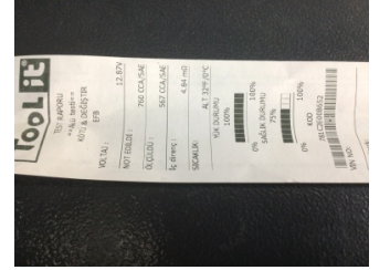
Elektrik donanımı/Pano, Akü > Test Sonucu