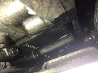
Şanzıman, Şanzıman > Yağ Kaçağı