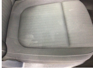
Koltuklar, ön, Koltuk, sağ ön > Kirlenmiş