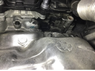
Motor, Motor üst kapağı, plastik > Yağ Kaçağı