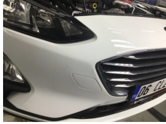
Tampon, ön, Ön tampon > Taş İzi