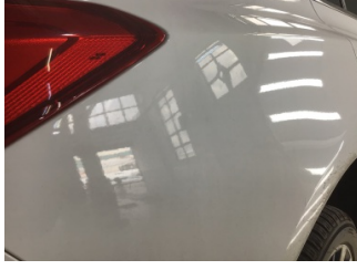
Çamurluk, sağ arka, Çamurluk, sağ arka > Ezik