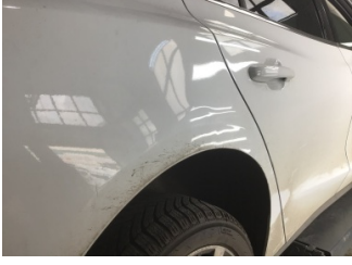
Çamurluk, sağ arka, Çamurluk, sağ arka > Ezik