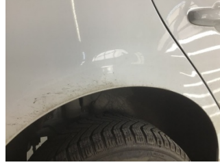
Çamurluk, sağ arka, Çamurluk, sağ arka > Ezik