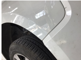
Çamurluk, sağ, Çamurluk, sağ > Standart Dışı Onarım