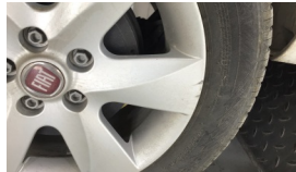
Jant, sağ arka > Çizik