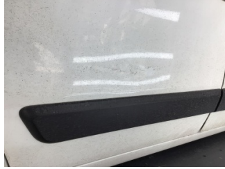
Kapı, sağ arka, Kapı, sağ arka > Çizik