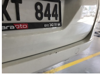
Bagaj kapağı/kapısı, Bagaj kapısı > Ezik