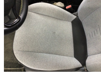
Koltuklar, ön, Koltuk, sol ön > Kirlenmiş