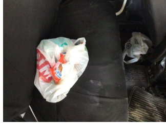
Koltuklar, arka, Arka koltuk > Kirlenmiş