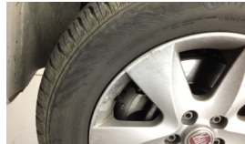
Jant, sol ön > Çizik