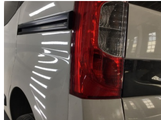
Arka lambalar, Arka lambalar, sol > Hasarlı