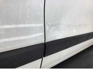
Kapı, sağ ön, Kapı, sağ ön > Ezik