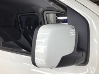
Dikiz aynası, sağ, Dış dikiz aynası > Çizik