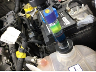
Motor, Silindir kapağı contası > Test Sonucu