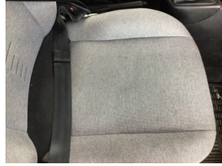
Koltuklar, ön, Koltuk, sağ ön > Kirlenmiş