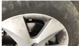
Jant, sağ ön > Çizik