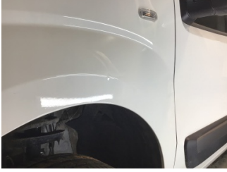
Çamurluk, sol, Çamurluk, sol > Noktasal Ezik