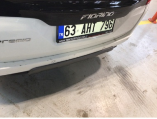
Tampon, arka, Arka tampon > Çizik