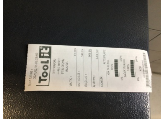
Elektrik donanımı/Pano, Akü > Test Sonucu