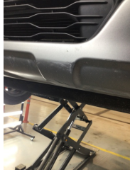
Tampon, ön, Ön tampon > Çizik