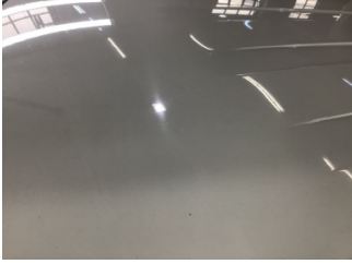
Tavan, Tavan > Noktasal Ezik