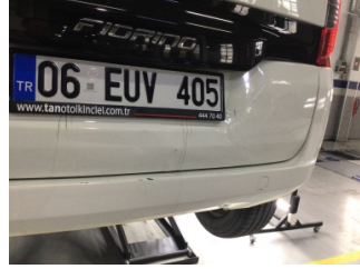
Bagaj kapağı/kapısı, Bagaj kapısı > Standart Dışı Onarım