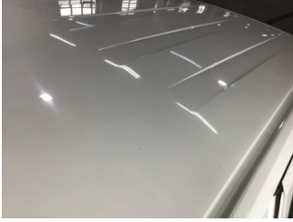
Tavan, Tavan > Yakıcı Madde ile Zarar Görmüş