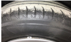
Lastik, sağ arka > Deforme Olmuş