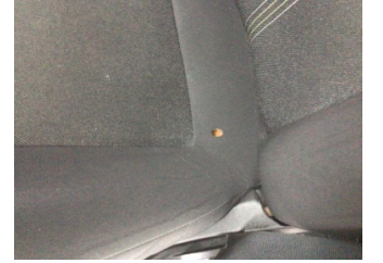
Koltuklar, ön, Koltuk, sol ön > Yakıcı Madde ile Zarar Görmüş