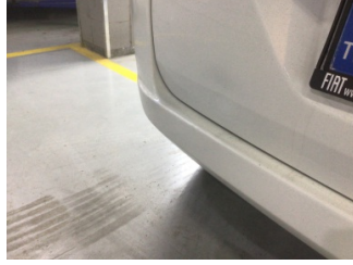
Bagaj kapağı/kapısı, Bagaj kapısı > Ezik