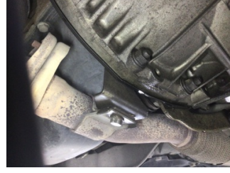
Şanzıman, Şanzıman > Yağ Kaçağı