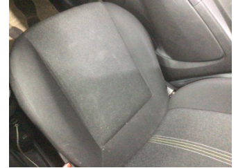
Koltuklar, ön, Koltuk, sağ ön > Kirlenmiş