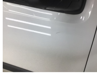
Kapı, sağ ön, Kapı, sağ ön > Çizik