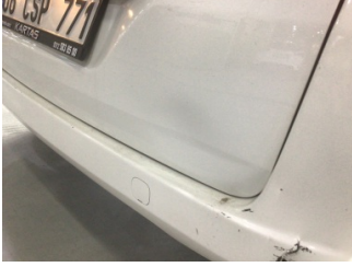
Bagaj kapağı/kapısı, Bagaj kapısı > Ezik