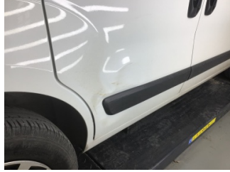
Kapı, sağ arka, Kapı, sağ arka > Hasarlı