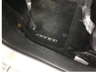
Taban, Taban halısı > Kirlenmiş