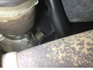
Ön aks, Aks mili, sağ > Yağ Kaçağı

Sayfa: 1/1 Araç Çıkış Tarihi: 19.11.2024 16:10