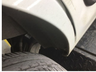
Çamurluk, sağ arka, Çamurluk ağı > Çizik