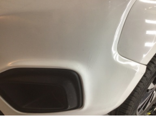
Tampon, ön, Ön tampon > Boyası Atmış