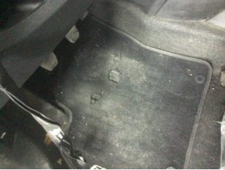
Taban, Paspaslar > Hasarlı