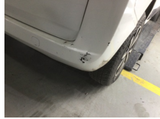
Tampon, arka, Arka tampon > Hasarlı