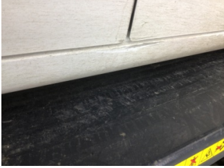
Marşbiyel, sağ, Marşbiyel, sağ > Çizik