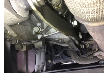
Şanzıman, Şanzıman > Yağ Kaçağı