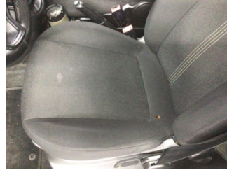
Koltuklar, ön, Koltuk, sol ön > Kirlenmiş