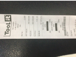
Elektrik donanımı/Pano, Akü > Test Sonucu