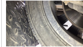
Lastik, ön > Hasarlı