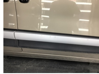
Kapı, sağ ön, Kapı bandı > Çizik