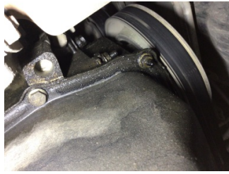
Motor, Triger zinciri > Yağ Kaçağı