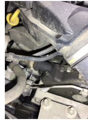
Motor, Triger zinciri > Yağ Kaçağı