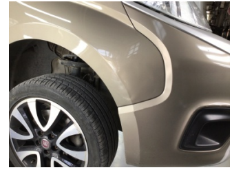
Çamurluk, sağ, Çamurluk, sağ > Standart Dışı Onarım