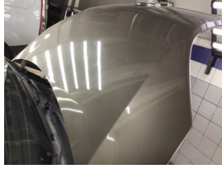
Motor kaputu, Motor kaputu > Yakıcı Madde İle Zarar Görmüş