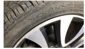
Lastik, ön > Hasarlı