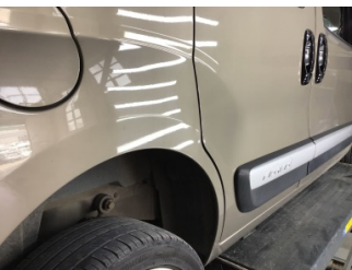
Çamurluk, sağ arka, Çamurluk ağız > Noktasal Ezik