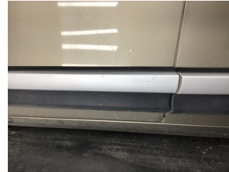
Kapı, sol ön, Kapı bandı > Çizik