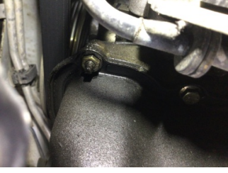
Motor, Triger zinciri kapağı > Yağ Kaçağı