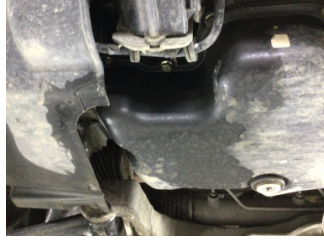
Motor, Yağ karteri contası > Yağ Kaçağı