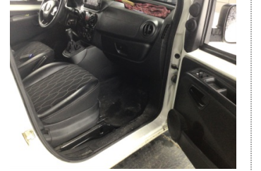
Döşemeler/Kapaklar, Döşemeler/Kapaklar > Çizik