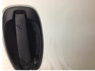
Kapı, sol arka, Kapı, sol arka > Çizik