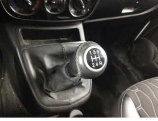
Şanzıman, Vites topuzu > Deforme Olmuş