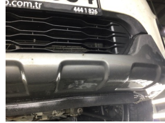
Tampon, ön, Spoiler > Çizik