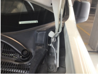
Motor kaputu, Dayama çubuğu/Amortisör > Hasarlı