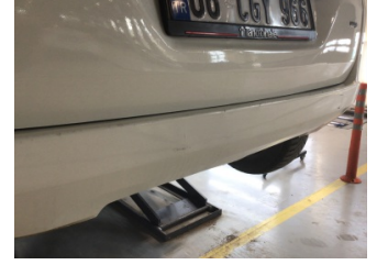
Tampon, arka, Arka tampon > Hasarlı