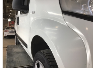
Çamurluk, sağ, Çamurluk, sağ > Hasarlı