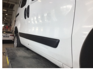
Kapı, sağ ön, Kapı, sağ ön > Hasarlı