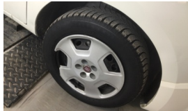
Jant kapağı, sağ ön > Hasarlı