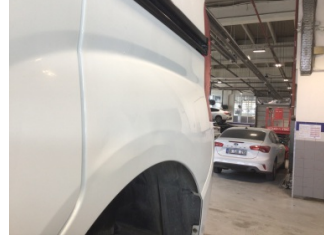
Çamurluk, sol arka, Çamurluk, sol arka > Hasarlı