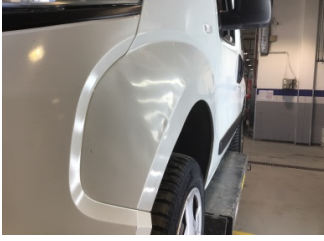
Çamurluk, sol, Çamurluk, sol > Hasarlı

Sayfa: 9/11 Araç Çıkış Tarihi: 01.03.2025 11:59