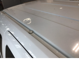
Tavan, Tavan > Ezik