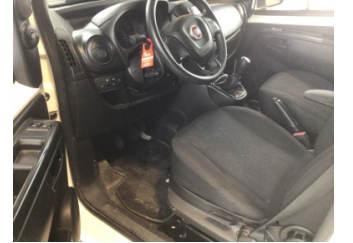
Döşemeler/Kapaklar, Döşemeler/Kapaklar > Kirlenmiş