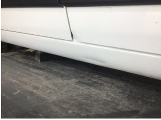
Marşbiyel, sağ, Marşbiyel, sağ > Hasarlı