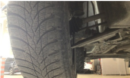
Tekerlek seti > Deforme Olmuş