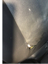
Koltuklar, arka, Arka koltuk döşemesi > Hasarlı