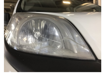
Farlar, Far camı, sağ > Hasarlı