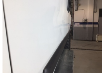
Kapı, sol ön, Kapı, sol ön > Hasarlı