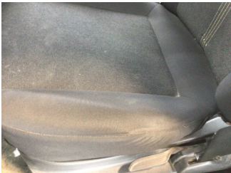
Döşemeler/Kapaklar, Döşemeler/Kapaklar > Deforme Olmuş