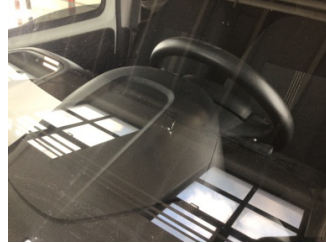
Camlar, Ön cam > Hasarlı