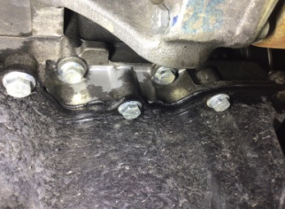
Motor, Yağ karteri > Yağ Kaçağı