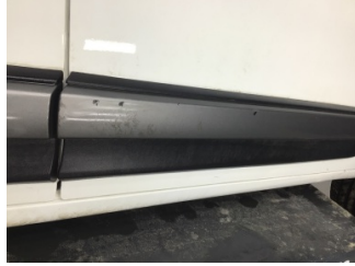
Kapı, sağ ön, Kapı bandı > Çizik