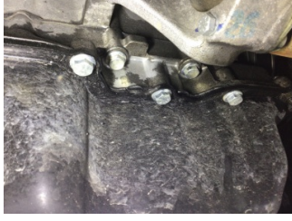
Motor, Yağ karteri > Yağ Kaçağı