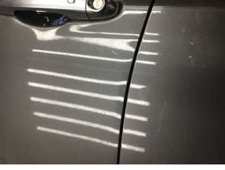
Kapı, sol ön, Kapı kenarı > Ezik