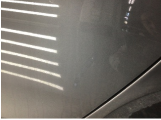
Kapı, sol arka, Kapı, sol arka > Çizik