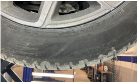
Lastik, sağ ön > Hasarlı