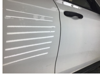
Kapı, sağ arka, Kapı, sağ arka > Noktasal Ezik