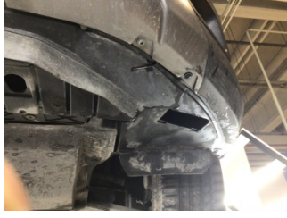
Tampon, ön, Spoiler > Hasarlı