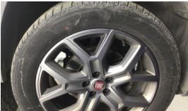
Jant, sağ ön > Çizik