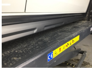
Marşbiyel, sağ, Marşbiyel plastiği, sağ > Çizik