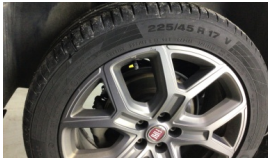
Jant, sağ arka > Çizik