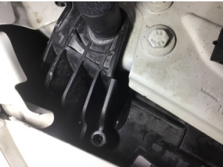
Farlar, Far, sağ > Hasarlı