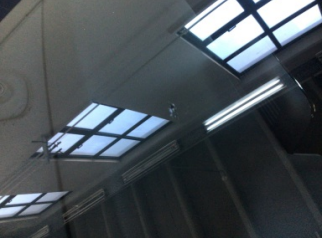
Camlar, Ön cam > Taş Vuruğu