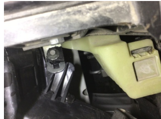
Farlar, Far, sağ > Hasarlı