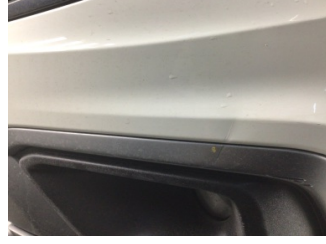
Tampon, ön, Ön tampon > Ezik