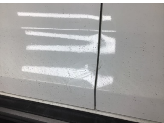
Kapı, sol ön, Kapı, sol ön > Noktasal Ezik