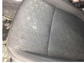
Koltuklar, ön, Koltuk, sol ön > Kirlenmiş