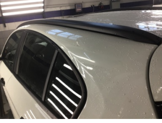
Tavan, Sol üst frangart > Ezik