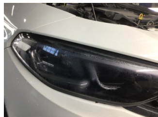
Farlar, Far, sağ > Deforme Olmuş