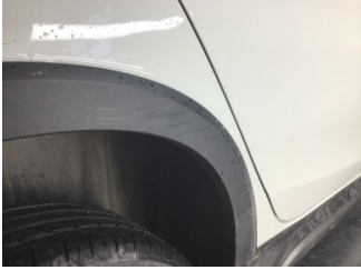
Çamurluk, sağ arka, Çamurluk ağzı > Çizik