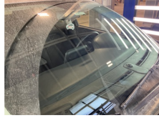
Camlar, Ön cam > Taş İzi