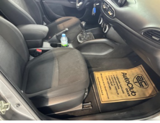
Döşemeler/Kapaklar, Döşemeler/Kapaklar > Kirlenmiş