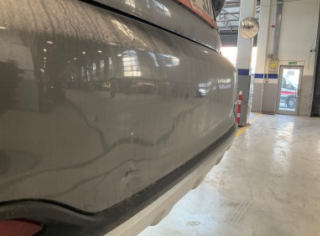
Tampon, arka, Arka tampon > Hasarlı