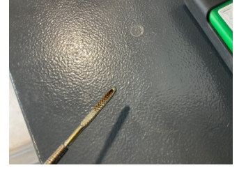
Motor, Yağ seviyesi > Eksik