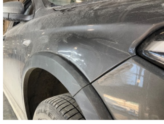
Çamurluk, sağ, Çamurluk, sağ > Standart Dışı Onarım