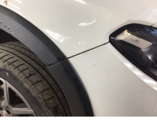
Tampon, ön, Ön tampon > Hasarlı