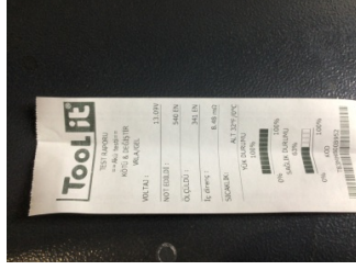
Elektrik donanımı/Pano, Akü > Test Sonucu