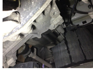
Şanzıman, Şanzıman > Yağ Kaçağı