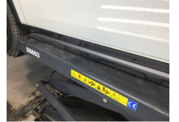
Marşbiyel, sol, Marşbiyel plastığı, sol > Çizik