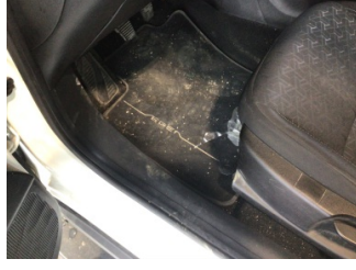
Taban, Taban halısı > Kirlenmiş