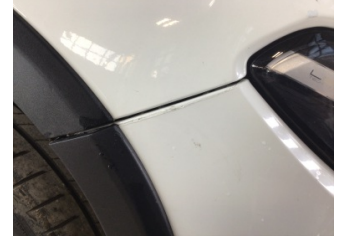
Tampon, ön, Ön tampon > Ayarsız