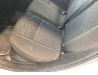
Koltuklar, arka, Arka koltuk > Kirlenmiş