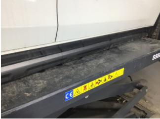
Marşbiyel, sağ, Marşbiyel, sağ > Çizik