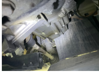
Şanzıman, Şanzıman > Yağ Kaçağı