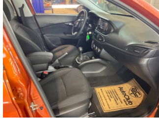
Döşemeler/Kapaklar, Döşemeler/Kapaklar > Kirlenmiş