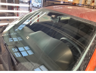
Camlar, Ön cam > Taş İzi