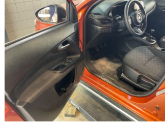
Döşemeler/Kapaklar, Döşemeler/Kapaklar > Kirlenmiş