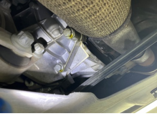
Şanzıman, Şanzıman > Yağ Kaçağı