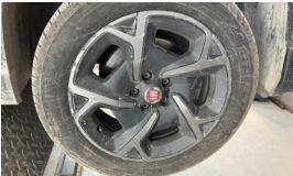
Jant kapağı seti > Çizik