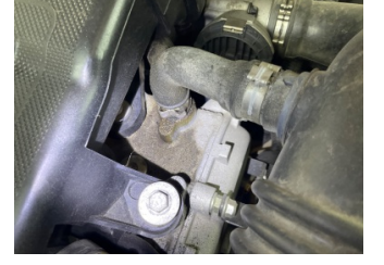
Motor, Motor üst kapağı, plastik > Yağ Kaçağı