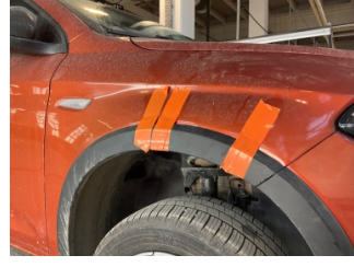
Çamurluk, sağ, Nikelaj, ızgara > Sabitlemesi Hatalı