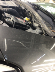
Çamurluk, sol, Çamurluk, sol > Çizik