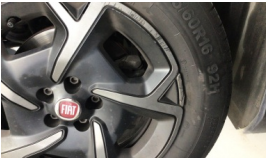
Jant kapağı, sağ ön > Hasarlı