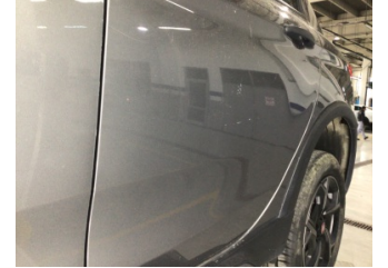
Kapı, sol arka, Kapı, sol arka > Çizik