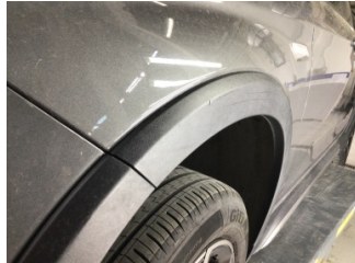
Çamurluk, sol, Çamurluk ağızı > Çizik