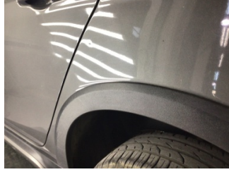
Çamurluk, sol arka, Çamurluk ağzı > Noktasal Ezik