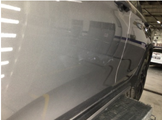
Kapı, sol ön, Kapı, sol ön > Çizik