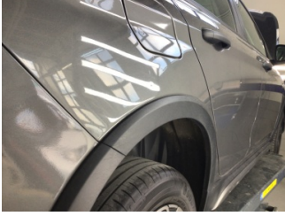
Çamurluk, sağ arka, Çamurluk, sağ arka > Noktasal Ezik