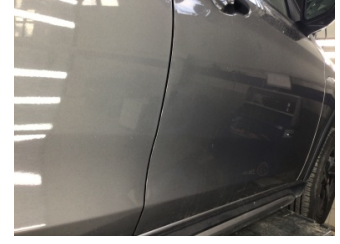
Kapı, sağ ön, Kapı, sağ ön > Noktasal Ezik