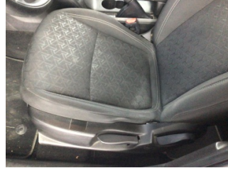
Koltuklar, ön, Koltuk, sol ön > Kirlenmiş