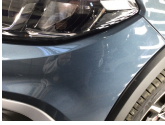
Tampon, ön, Ön tampon > Taş İzi