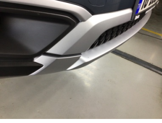
Tampon, ön, Ön tampon > Taş İzi