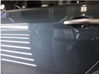
Kapı, sol arka, Kapı, sol arka > Çizik