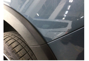
Çamurluk, sol arka, Çamurluk, sol arka > Çizik