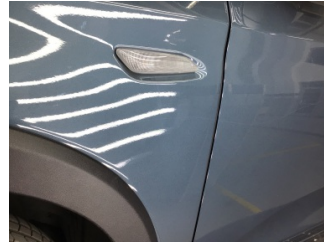
Çamurluk, sol, Çamurluk, sol > Çizik