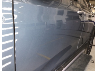
Kapı, sol ön, Kapı, sol ön > Çizik