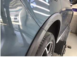
Çamurluk, sağ arka, Çamurluk ağız > Çizik