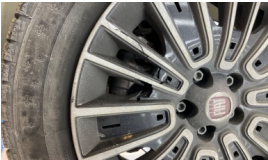
Jant kapağı, sol ön > Hasarlı