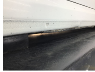
Marşbiyel, sol, Marşbiyel, sol > Ezik