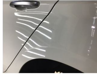
Çamurluk, sol arka, Çamurluk, sol arka > Çizik