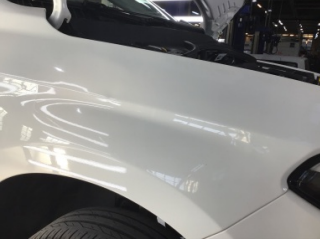
Çamurluk, sağ, Çamurluk, sağ > Ezik