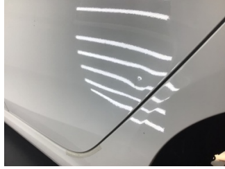
Kapı, sol arka, Kapı, sol arka > Noktasal Ezik