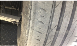
Lastik, ön > Deforme Olmuş