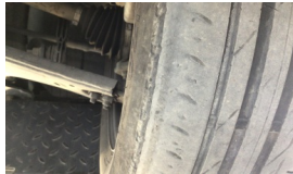
Lastik, ön > Deforme Olmuş