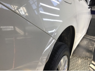
Çamurluk, sağ arka, Çamurluk, sağ arka > Noktasal Ezik