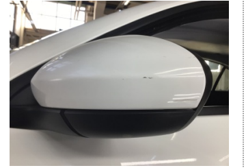
Dikiz aynası, sol, Dış dikiz aynası > Çizik