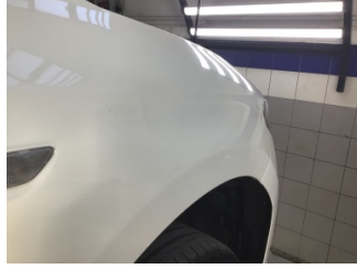
Çamurluk, sağ, Çamurluk, sağ > Ezik