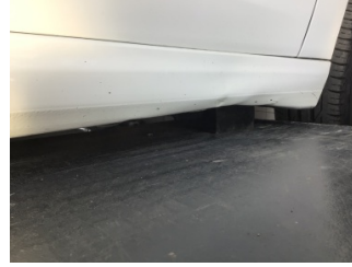
Marşbiyel, sağ, Marşbiyel, sağ > Hasarlı