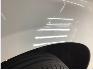
Çamurluk, sol, Çamurluk, sol > Çizik