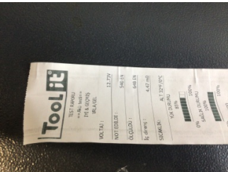
Elektrik donanımı/Pano, Akü > Test Sonucu