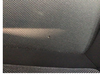
Koltuklar, ön, Koltuk, sol ön > Yakıcı Madde Ile Zarar Görmüş