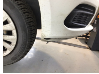
Tampon, ön, Ön tampon > Çizik