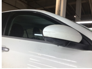
Dikiz aynası, sağ, Dış dikiz aynası > Çizik