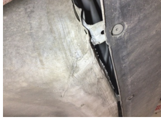
Arka bölüm, Bagaj havuzu > Ezik