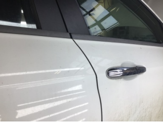
Kapı, sağ arka, Kapı, sağ arka > Çizik