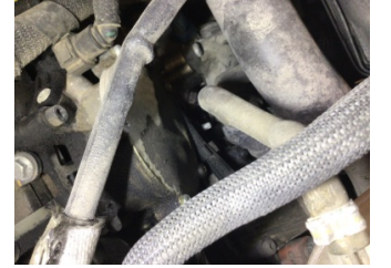
Motor, Motor üst kapağı, plastik > Yağ Kaçağı