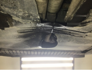
Motor, Alt muhafaza > Hasarlı