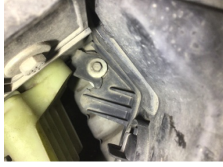
Farlar, Far, sol > Hasarlı