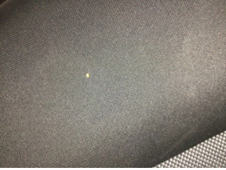
Koltuklar, arka, Arka koltuk > Kirlenmiş