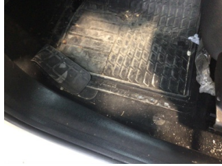
Taban, Taban halısı > Kirlenmiş