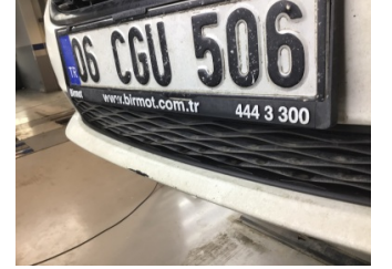
Tampon, ön, Ön tampon > Çizik