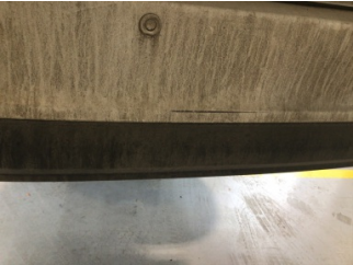
Tampon, arka, Arka tampon > Çizik