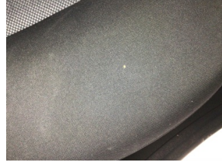
Koltuklar, arka, Arka koltuk > Yakıcı Madde Ile Zarar Görmüş