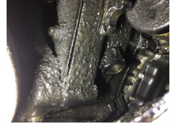
Motor, Yağ karteri > Yağ Kaçağı