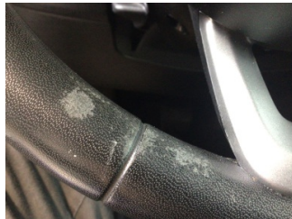
Direksiyon sistemi, Direksiyon simidi > Deforme Olmuş