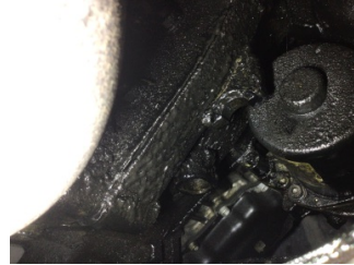
Motor, Yağ karteri > Yağ Kaçağı