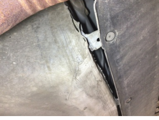
Arka bölüm, Arka sac/panel > Ezik