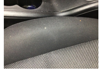
Koltuklar, ön, Koltuk, sağ ön > Yakıcı Madde Ile Zarar Görmüş