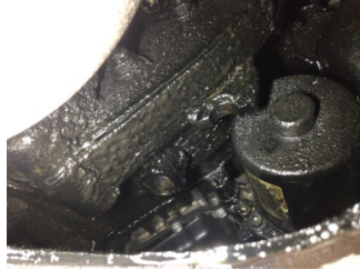
Şanzıman, Şanzıman > Yağ Kaçağı