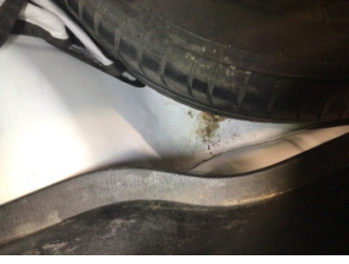
Arka bölüm, Bagaj havuzu > Boyalı

Sayfa: 9/10 Araç Çıkış Tarihi: 03.01.2025 09:32