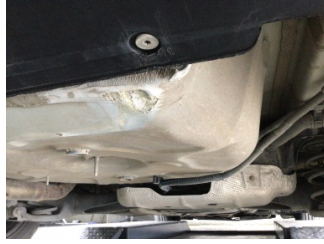
Arka bölüm, Bagaj havuzu > Ezik