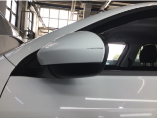
Dikiz aynası, sol, Dış dikiz aynası > Çizik