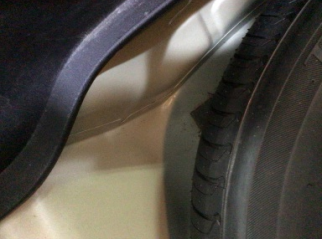
Arka bölüm, Bagaj havuzu > Ezik