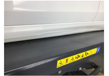
Marşbiyel, sol, Marşbiyel, sol > Hasarlı