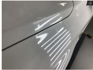
Çamurluk, sol, Çamurluk, sol > Yakıcı Madde ile Zarar Görmüş