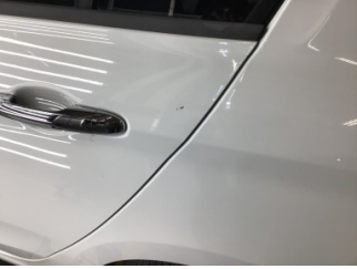
Kapı, sol arka, Kapı, sol arka > Çizik