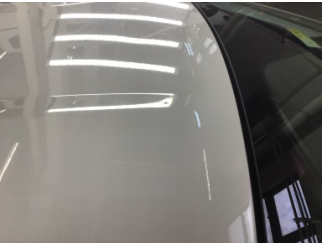
Tavan, Tavan > Noktasal Ezik