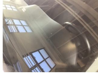
Camlar, Ön cam > Taş Vuruğu