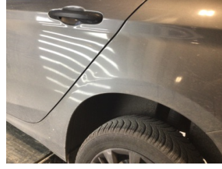
Çamurluk, sol arka, Çamurluk, sol arka > Ezik