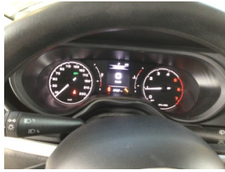
Motor, Bakım > Uyarı Lambası Yanıyor