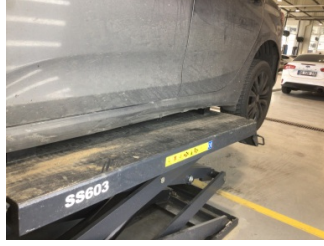
Marşbiyel, sol, Marşbiyel, sol > Hasarlı