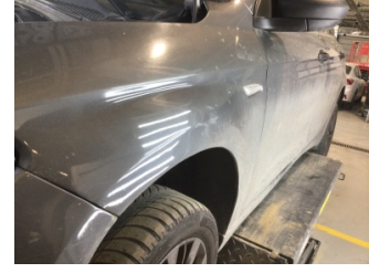
Çamurluk, sol, Çamurluk, sol > Ezik