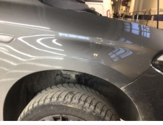
Çamurluk, sağ, Çamurluk, sağ > Ezik