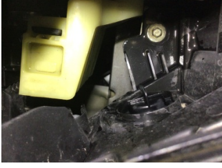
İlave parçalar, ön, Ön koruma demiri > Hasarlı