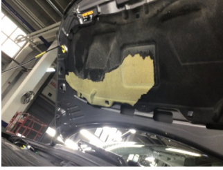
Motor kaputu, İzolasyon döşemesi > Hasarlı