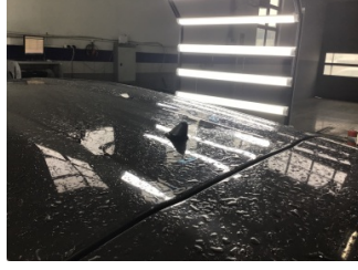
Komünikasyon/Navigasyon/EğlenceKoltuklar, ön, Koltuk, sol ön > sistemleri, Anten > Sökülmüş-Yok Yakıcı Madde İle Zarar Görmüş