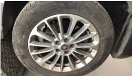
Jant, sağ ön > Çizik