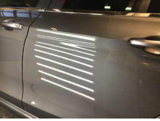
Kapı, sol arka, Kapı, sol arka > Noktasal Ezik