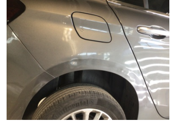
Çamurluk, sağ arka, Çamurluk, sağ arka > Hasarlı