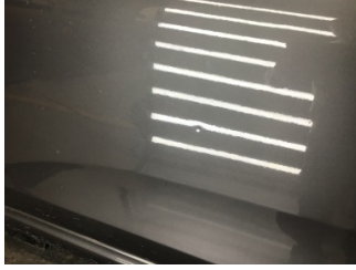
Kapı, sol ön, Kapı, sol ön > Noktasal Ezik