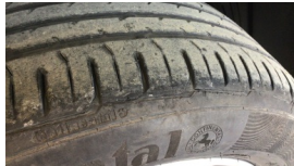
Lastik, ön > Deforme Olmuş