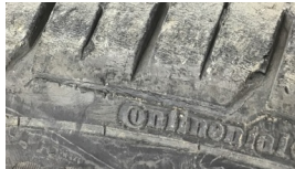
Lastik, ön > Deforme Olmuş