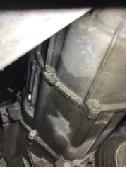
Şanzıman, Şanzıman > Yağ Kaçağı