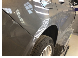
Çamurluk, sağ arka, Çamurluk, sağ arka > Hasarlı