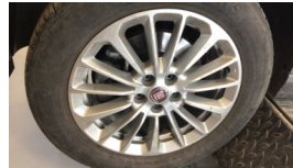
Jant, sol ön > Çizik