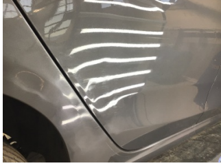
Kapı, sağ arka, Kapı, sağ arka > Hasarlı