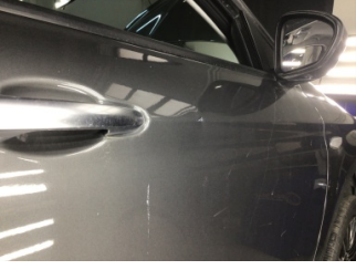
Kapı, sağ ön, Kapı, sağ ön > Ezik