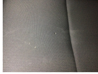
Koltuklar, ön, Koltuk, sol ön > Yakıcı Madde ile Zarar Görmüş