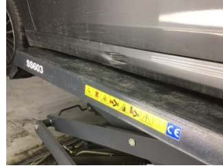
Marşbiyel, sol, Marşbiyel, sol > Hasarlı