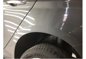
Çamurluk, sol arka, Çamurluk, sol arka > Çizik