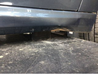
Marşbiyel, sağ, Marşbiyel, sağ > Hasarlı