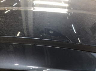
Tavan, Tavan > Yakıcı Madde ile Zarar Görmüş