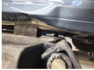
Marşbiyel, sağ, Marşbiyel, sağ > Hasarlı