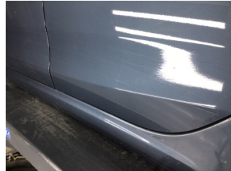
Kapı, sol arka, Kapı, sol arka > Çizik