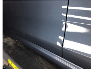
Kapı, sol ön, Kapı, sol ön > Çizik