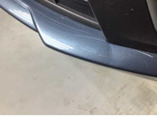
Tampon, ön, Ön tampon > Ezik