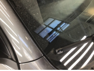
Camlar, Ön cam > Taş Vuruğu