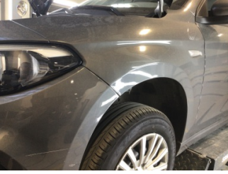
Çamurluk, sol, Çamurluk, sol > Ezik