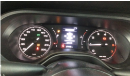
Tekerlek/Lastik > Uyarı Lambası Yanıyor