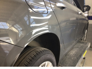
Çamurluk, sağ arka, Çamurluk, sağ arka > Ezik