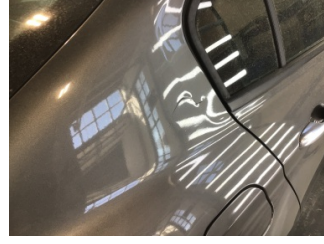
Çamurluk, sağ arka, Çamurluk, sağ arka > Ezik