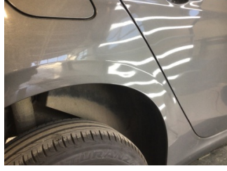
Çamurluk, sağ arka, Çamurluk, sağ arka > Ezik