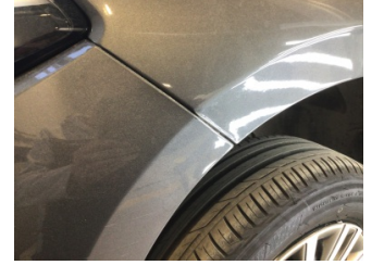
Çamurluk, sol, Çamurluk, sol > Standart Dışı Onarım