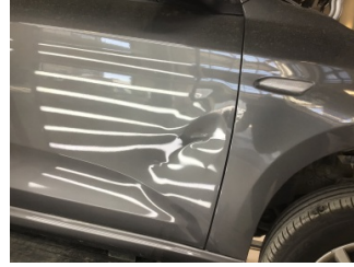
Kapı, sağ ön, Kapı, sağ ön > Hasarlı