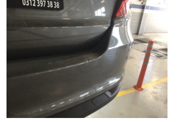
Tampon, arka, Arka tampon > Ezik