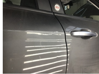
Kapı, sağ arka, Kapı, sağ arka > Standart Dışı Onarım