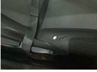
Koltuklar, ön, Koltuk, sol ön > Deforme Olmuş

Sayfa: 9/10 Araç Çıkış Tarihi: 25.12.2024 16:51