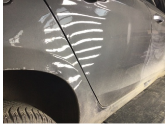
Kapı, sağ arka, Kapı, sağ arka > Standart Dışı Onarım