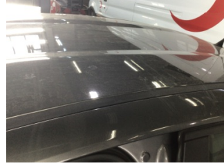
Tavan, Tavan > Yakıcı Madde ile Zarar Görmüş