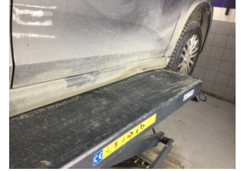
Marşbiyel, sağ, Marşbiyel, sağ > Hasarlı