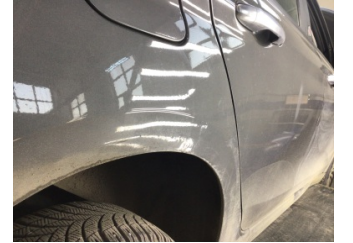
Çamurluk, sağ arka, Çamurluk, sağ arka > Standart Dışı Onarım