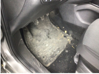
Taban, Paspaslar > Deforme Olmuş