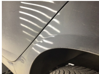
Çamurluk, sol arka, Çamurluk, sol arka > Noktasal Ezik