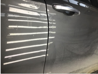
Kapı, sağ ön, Kapı, sağ ön > Standart Dışı Onarım