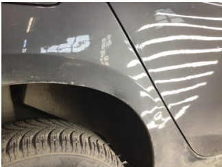
Çamurluk, sağ arka, Çamurluk, sağ arka > Standart Dışı Onarım