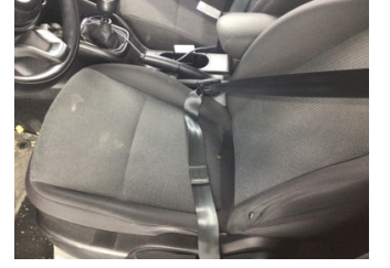
Koltuklar, ön, Koltuk, sol ön > Kirlenmiş