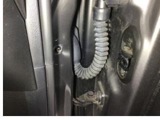
Kapı, sağ ön, Kapı gergisi > Hasarlı