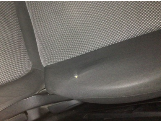
Koltuklar, ön, Koltuk, sol ön > Deforme Olmuş