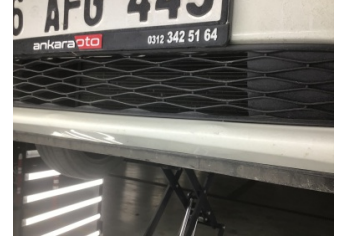
Tampon, ön, Ön tampon > Ezik