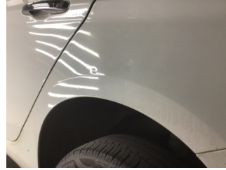
Çamurluk, sol arka, Çamurluk, sol arka > Çizik