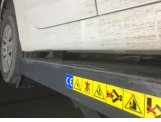
Marşbiyel, sağ, Marşbiyel, sağ > Ezik