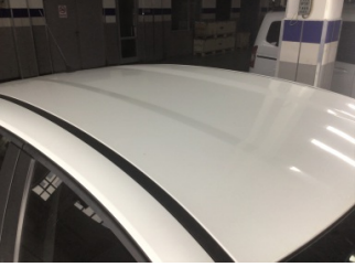
Tavan, Tavan > Yakıcı Madde ile Zarar Görmüş