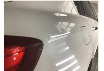
Çamurluk, sağ arka, Çamurluk, sağ arka > Noktasal Ezik