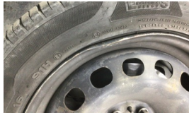
Jant, sol ön > Ezik