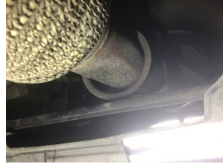
Egzoz sistemi, Esnek boru > Ezik