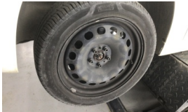
Jant, sol ön > Sökülmüş-Yok