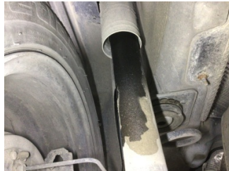
Arka aks, Amortisör, arka sol > Yağ Kaçağı