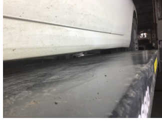
Marşbiyel, sol, Marşbiyel, sol > Ezik