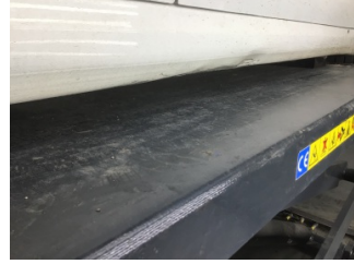
Marşbiyel, sağ, Marşbiyel, sağ > Hasarlı