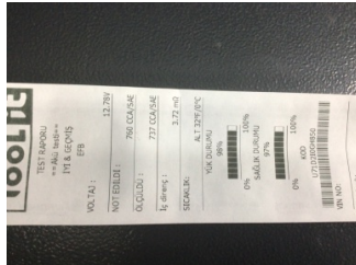
Elektrik donanımı/Pano, Akü > Test Sonucu