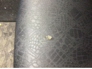
Koltuklar, ön, Koltuk, sol ön > Hasarlı