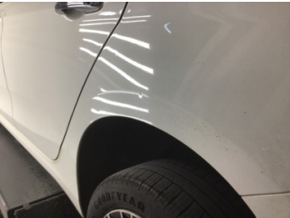
Çamurluk, sol arka, Çamurluk, sol arka > Noktasal Ezik