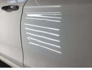
Kapı, sol arka, Kapı, sol arka > Ezik