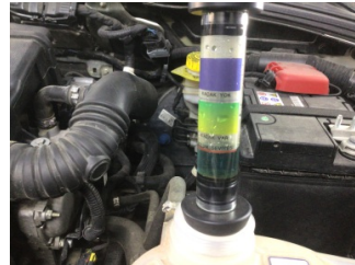
Motor, Silindir kapağı contası > Test Sonucu