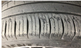
Lastik, ön > Deforme Olmuş