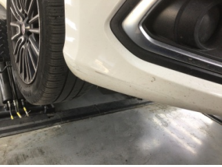
Tampon, ön, Ön tampon > Çizik