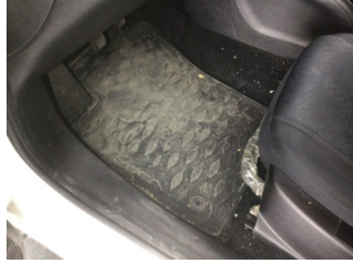
Taban, Taban halısı > Kirlenmiş