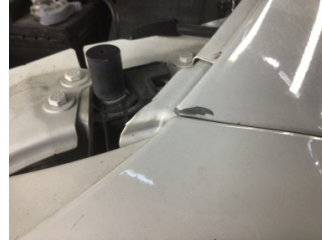
Çamurluk, sol, Çamurluk, sol > Çizik