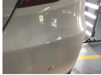
Tampon, arka, Arka tampon > Çizik