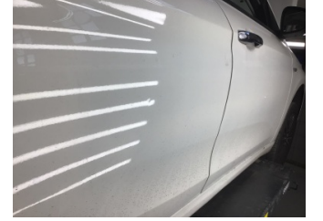
Kapı, sağ arka, Kapı, sağ arka > Noktasal Ezik