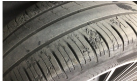
Lastik, ön > Deforme Olmuş