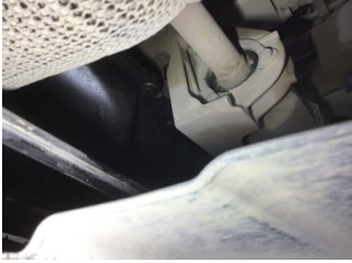
Motor, Yağ karteri > Yağ Kaçağı