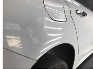
Çamurluk, sağ arka, Çamurluk, sağ arka > Çizik