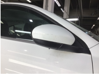
Dikiz aynası, sağ, Dış dikiz aynası > Çizik