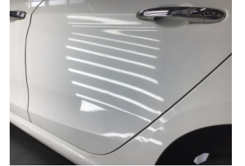
Kapı, sol arka, Kapı, sol arka > Çizik