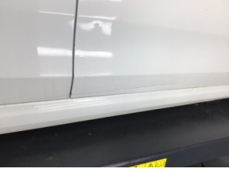
Kapı, sağ ön, Kapı, sağ ön > Ezik