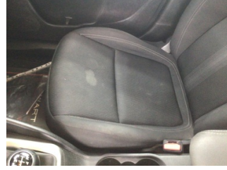
Koltuklar, ön, Koltuk, sağ ön > Kirlenmiş