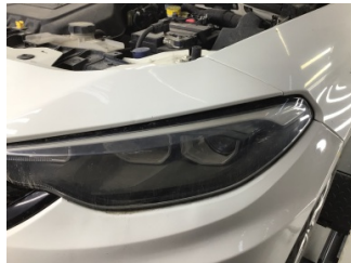
Farlar, Far, sol > Solmuş