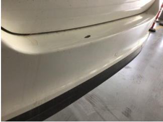
Tampon, arka, Arka tampon > Boyası Atmış