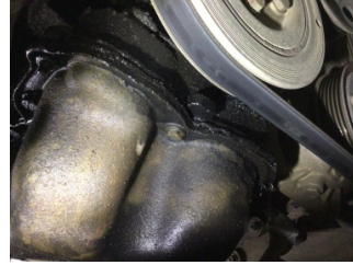
Motor, Triger zinciri kapağı > Yağ Kaçağı