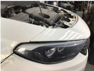
Farlar, Far, sağ > Solmuş