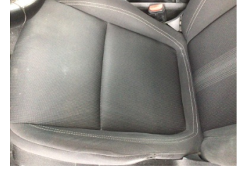
Koltuklar, ön, Koltuk, sol ön > Kirlenmiş