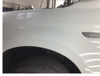
Çamurluk, sol, Çamurluk, sol > Ezik