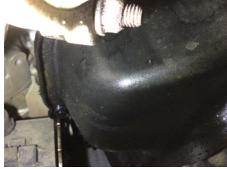
Motor, Yağ karteri > Yağ Kaçağı