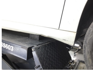
Marşbiyel, sağ, Marşbiyel, sağ > Hasarlı