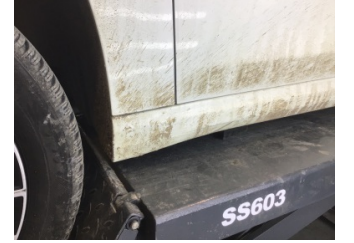
Marşbiyel, sol, Marşbiyel, sol > Çizik