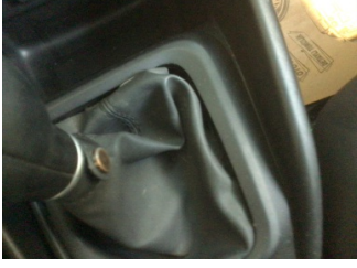
Şanzıman, Vites körüğü > Deforme Olmuş

Sayfa: 9/10 Araç Çıkış Tarihi: 10.03.2025 11:49