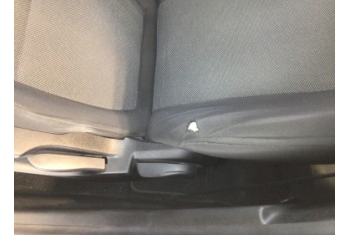
Koltuklar, ön, Koltuk, sol ön > Deforme Olmuş