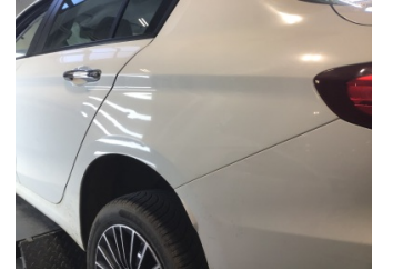
Çamurluk, sol arka, Çamurluk, sol arka > Noktasal Ezik