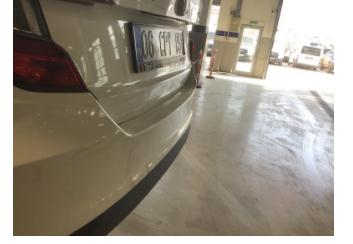
Tampon, arka, Arka tampon > Ezik