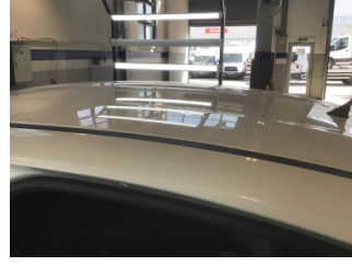
Tavan, Tavan > Noktasal Ezik