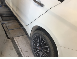
Çamurluk, sol arka, Çamurluk, sol arka > Ezik