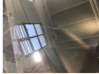
Camlar, Ön cam > Taş İzi