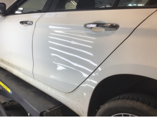
Kapı, sol arka, Kapı, sol arka > Ezik