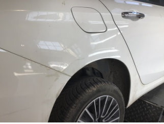
Çamurluk, sağ arka, Çamurluk, sağ arka > Çizik