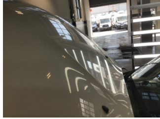
Motor kaputu, Motor kaputu > Noktasal Ezik