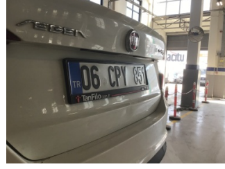
Bagaj kapağı/kapısı, Bagaj kapısı > Ezik