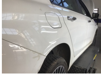
Çamurluk, sağ arka, Çamurluk, sağ arka > Ezik