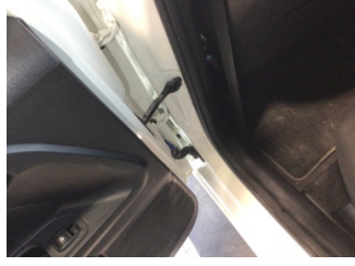
Kapı, sol arka, Kapı gergisi > Ses Yapıyor