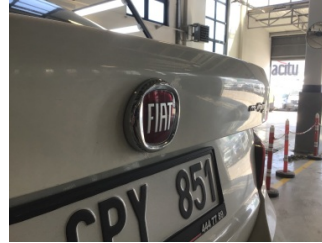
Bagaj kapağı/kapısı, Bagaj kapısı > Standart Dışı Onarım