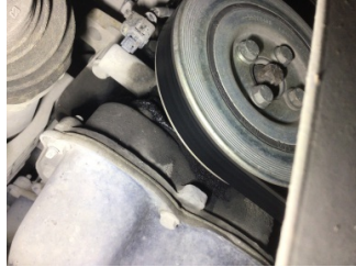
Motor, Triger zinciri kapağı > Yağ Kaçağı