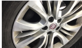
Jant, sol ön > Çizik