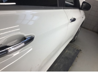
Kapı, sağ arka, Kapı, sağ arka > Noktasal Ezik