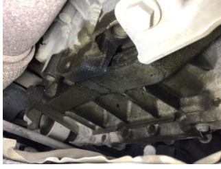
Şanzıman, Şanzıman > Yağ Kaçığı