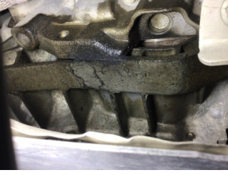
Şanzıman, Şanzıman > Yağ Kaçığı