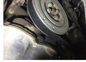
Motor, Triger zinciri kapağı > Yağ Kaçığı