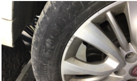
Jant, sağ ön > Çizik