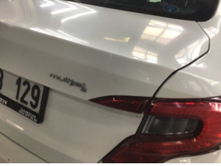
Bagaj kapağı/kapısı, Bagaj kapısı > Noktasal Ezik