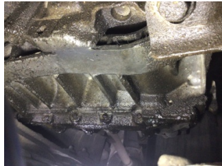
Şanzıman, Şanzıman > Yağ Kaçığı