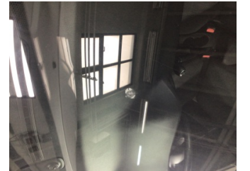
Camlar, Ön cam > Hasarlı