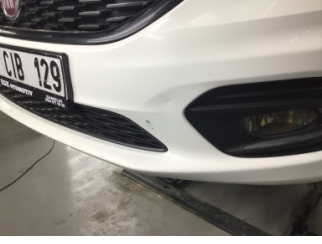
Tampon, ön, Ön tampon > Ezik