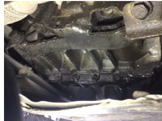
Şanzıman, Şanzıman > Yağ Kaçığı