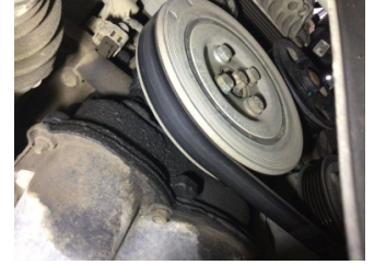
Motor, Triger zinciri kapağı > Yağ Kaçığı