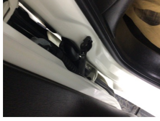
Kapı, sol ön, Kapı gergisi > Ses Yapıyor