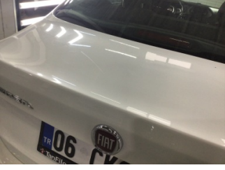
Bagaj kapağı/kapısı, Bagaj kapısı > Çizik

Sayfa: 8/10 Araç Çıkış Tarihi: 02.12.2024 09:37