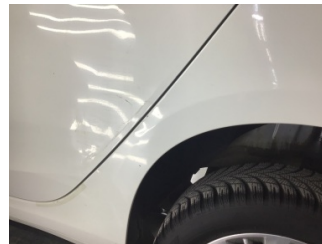
Çamurluk, sol arka, Çamurluk, sol arka > Ezik