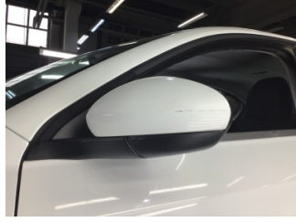
Dikiz aynası, sol, Dış dikiz aynası > Çizik