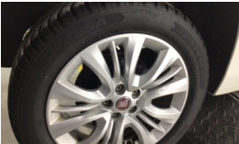
Jant, sağ arka > Çizik