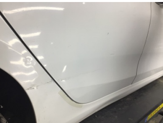
Kapı, sağ arka, Kapı, sağ arka > Ezik