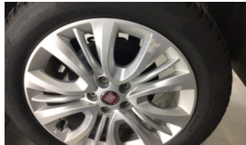
Jant, sol arka > Çizik