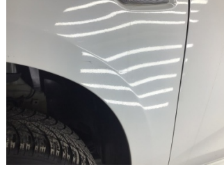
Çamurluk, sol, Çamurluk, sol > Çizik