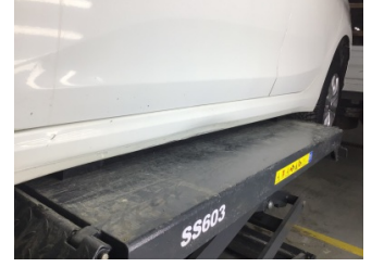
Marşbiyel, sol, Marşbiyel, sol > Hasarlı