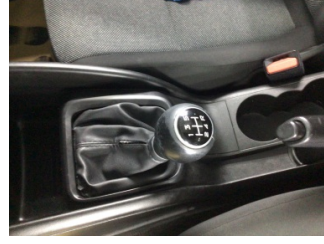
Şanzıman, Vites topuzu > Deforme Olmuş