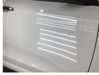
Kapı, sağ ön, Kapı, sağ ön > Çizik