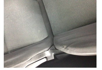
Koltuklar, ön, Koltuk, sol ön > Deforme Olmuş