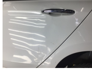
Kapı, sol arka, Kapı, sol arka > Hasarlı