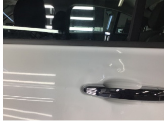
Kapı, sol arka, Kapı, sol arka > Standart Dışı Onarım