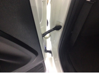
Kapı, sol arka, Kapı gergisi > Ses Yapıyor