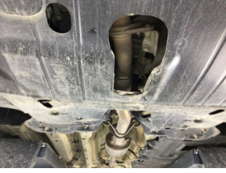
Motor, Alt muhafaza > Hasarlı