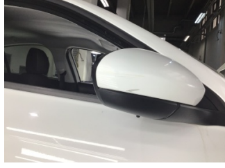
Dikiz aynası, sağ, Dış dikiz aynası > Çizik