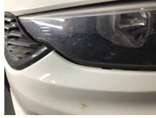
Tampon, ön, Ön tampon > Sabitlemesi Hatalı