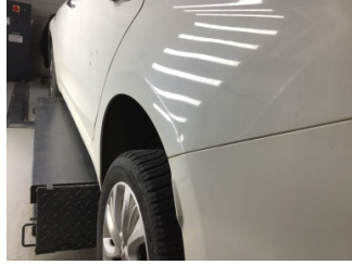
Çamurluk, sol arka, Çamurluk, sol arka > Noktasal Ezik