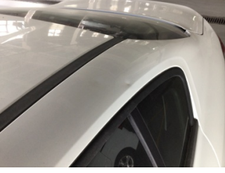
Tavan, Sol üst frangart > Ezik