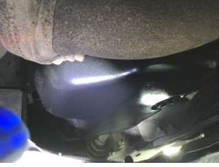
Motor, Yağ karteri > Yağ Kaçağı