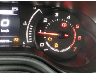
Motor, Motor > Uyarı Lambası Yanıyor