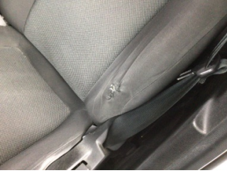
Koltuklar, ön, Koltuk döşemesi, sol ön > Hasarlı