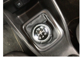
Şanzıman, Vites topuzu > Deforme Olmuş