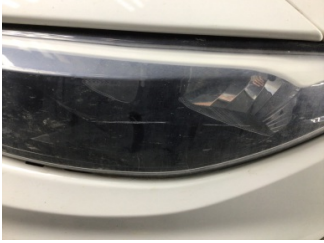
Farlar, Far camı, sol > Çizik