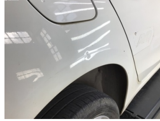
Çamurluk, sağ arka, Çamurluk, sağ arka > Noktasal Ezik