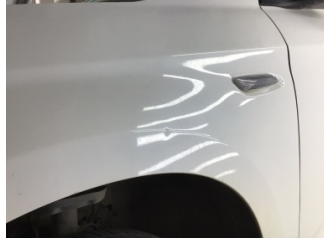
Çamurluk, sol, Çamurluk, sol > Noktasal Ezik