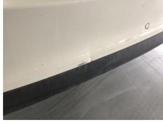
Tampon, arka, Arka tampon > Ezik