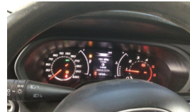
Tekerlek/Lastik > Uyarı Lambası Yanıyor