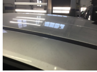
Tavan, Tavan > Standart Dışı Onarım