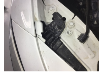
Farlar, Far bağlantı ayağı, sağ > Hasarlı