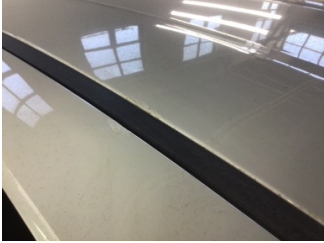
Tavan, Sol üst frangart > Standart Dışı Onarım