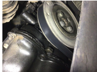
Motor, Triger zinciri kapağı > Yağ Kaçağı