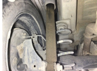
Arka aks, Amortisör, arka sol > Sızdırıyor