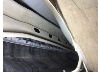
Arka bölüm, Römork çeki demiri > Hasarlı