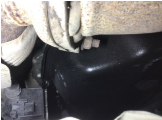
Motor, Yağ karteri > Yağ Kaçağı