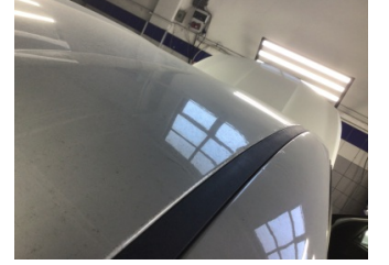
Tavan, Tavan > Standart Dışı Onarım