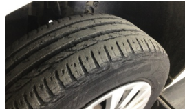
Lastik, ön > Deforme Olmuş