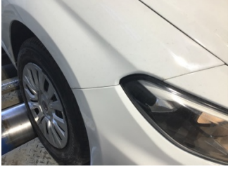
Çamurluk, sağ, Çamurluk, sağ > Standart Dışı Onarım