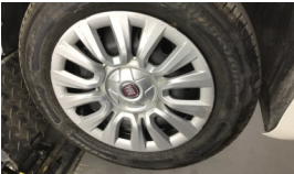
Lastik tamir seti > Çizik