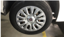
Lastik tamir seti > Çizik