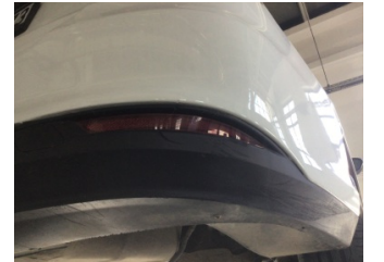
Tampon, arka, Spoiler > Hasarlı