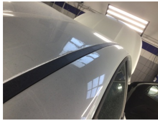
Tavan, Sağ üst frangart > Ezik