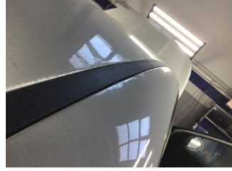
Tavan, Sağ üst frangart > Standart Dışı Onarım