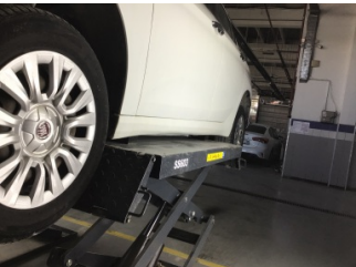
Marşbiyel, sol, Marşbiyel, sol > Ezik