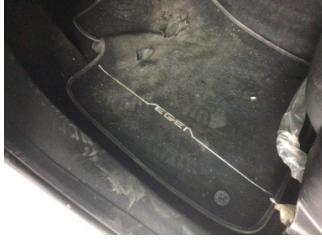
Taban, Paspaslar > Deforme Olmuş