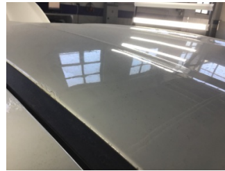
Tavan, Tavan > Ezik