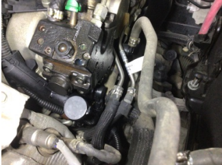
Motor, Yakıt sistemi yüksek basınç pompası > Sızdırıyor