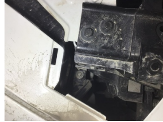
Farlar, Far bağlantı ayağı, sağ > Hasarlı