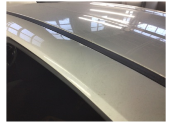
Tavan, Sol üst frangart > Ezik