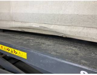
Marşbiyel, sağ, Marşbiyel, sağ > Hasarlı