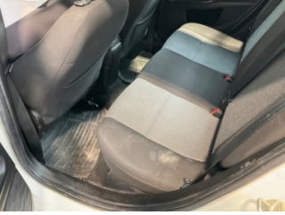
Döşemeler/Kapaklar, Döşemeler/Kapaklar > Kirlenmiş