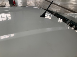
Tavan, Tavan > Ezik