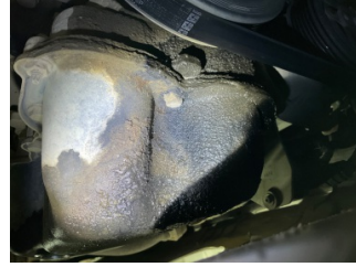
Motor, Triger zinciri kapağı > Yağ Kaçağı