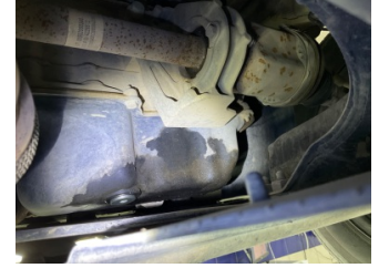
Motor, Yağ karteri > Yağ Kaçağı