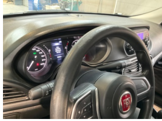
Direksiyon sistemi, Direksiyon simidi > Deforme Olmuş