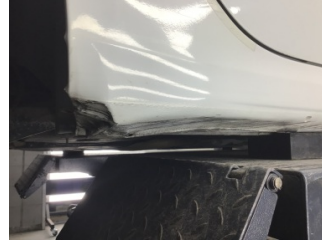
Marşbiyel, sağ, Marşbiyel, sağ > Hasarlı