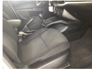
Döşemeler/Kapaklar, Döşemeler/Kapaklar > Kirlenmiş