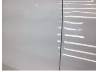
Kapı, sağ ön, Kapı, sağ ön > Ezik