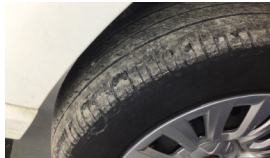
Lastik, sağ ön > Hasarlı