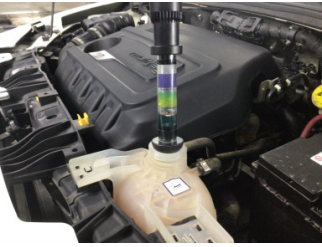
Motor, Silindir kapağı contası > Test Sonucu