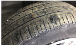
Lastik, sol ön > Hasarlı