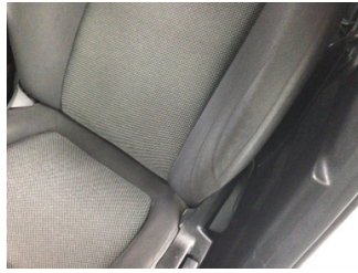
Koltuklar, ön, Koltuk döşemesi, sol ön > Deforme Olmuş