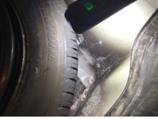
Arka bölüm, Bagaj havuzu > Ezik