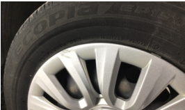
Jant kapağı, sol arka > Çizik