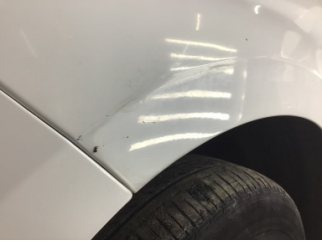
Çamurluk, sol, Çamurluk, sol > Boyası Atmış