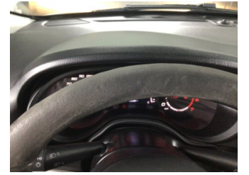
Direksiyon sistemi, Direksiyon simidi > Deforme Olmuş