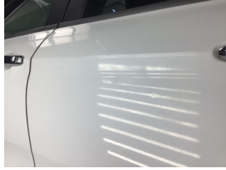
Kapı, sol arka, Kapı, sol arka > Noktasal Ezik