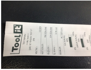
Elektrik donanımı/Pano, Akü > Test Sonucu