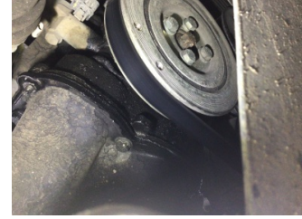
Motor, Triger zinciri kapağı > Yağ Kaçağı