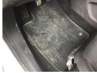
Taban, Taban halısı > Kirlenmiş