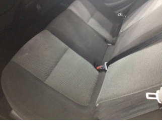
Koltuklar, arka, Arka koltuk > Kirlenmiş