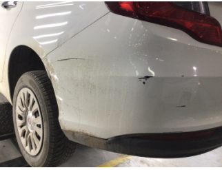
Tampon, arka, Arka tampon > Hasarlı