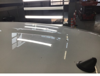
Tavan, Tavan > Ezik