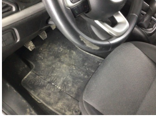
Direksiyon sistemi, Direksiyon simidi > Deforme Olmuş