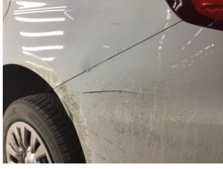
Çamurluk, sol arka, Çamurluk, sol arka > Ezik