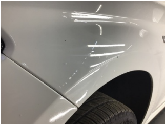
Çamurluk, sol, Çamurluk, sol > Küçük Çizik