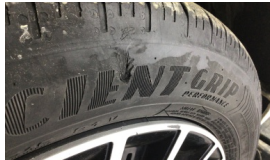
Lastik, ön > Hasarlı