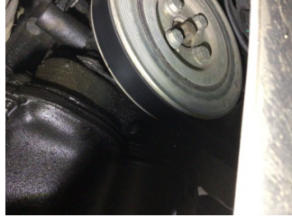
Motor, Triger zinciri kapağı > Yağ Kaçağı