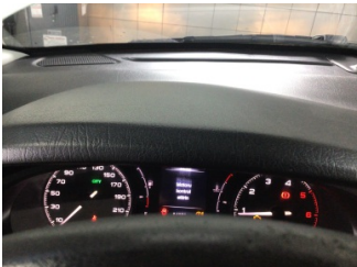
Motor, Motor > Uyarı Lambası Yanıyor