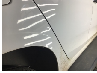
Çamurluk, sağ arka, Çamurluk ağız > Ezik