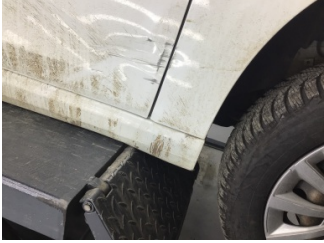
Çamurluk, sağ, Çamurluk, sağ > Çizik