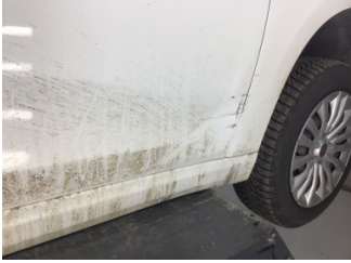
Kapı, sağ ön, Kapı, sağ ön > Hasarlı