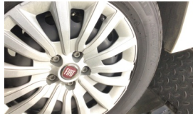
Jant kapağı seti > Hasarlı