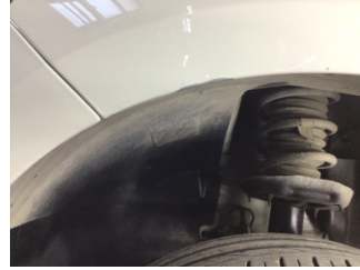
Çamurluk, sol, Çamurluk, sol > Çizik