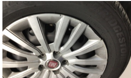
Jant kapağı seti > Hasarlı